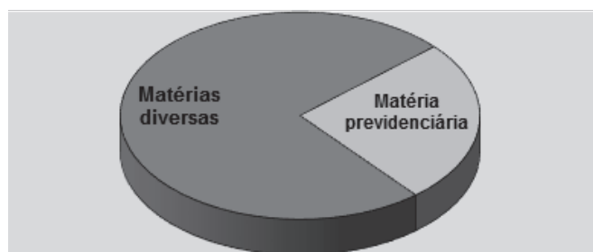
Gráfico 1. Demanda previdenciária na DPU- João Pessoa/PB

Não obstante serem muitas as possibilidades de atuação da DPU (junto a instituições como à Caixa Econômica Federal , às Universidades e Institutos Federais, ao Ministério da Educação e Cultura e Fundo Nacional de Desenvolvimento da Educação, nas demandas de direito internacional, direito à saúde, nos processos criminais federais e ações de improbidade administrativa, entre outros), a partir dos dados coletados, observa-se que dos 3.661 PAJs instaurados, 933 diziam respeito a algum tipo de demanda previdenciária, o que corresponde a cerca de 25% (25,48%) das demandas que foram apresentadas à DPU-João Pessoa/PB nos anos de 2013 e 2014.