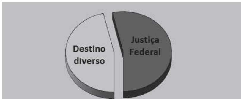
Gráfico 4. Demandas previdenciárias judicializadas pela DPU- João Pessoa/PB

O destino da outra parte é múltiplo: muitos PAJs são arquivados por desistência do assistido ou da assistida e outros tantos podem ainda estar em fase de instrução, por se tratarem de casos mais complexos, uma vez que a equipe de profissionais da DPU- João Pessoa/PB tem a responsabilidade de ajuizar ações bem instruídas, para que não sejam responsáveis por decisões desfavoráveis, por fragilidade nas sustentações, que se tornam imutáveis pela preclusão e pela coisa julgada material. Forçoso pontuar, nesse aspecto, que os dados foram coletados no segundo semestre do ano de 2015.