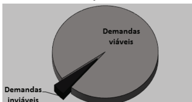
Gráfico 2. Viabilidade das demandas previdenciárias na DPU- João Pessoa/PB

Esse dado mostra que em 95,92% dos casos houve possibilidade de se obter melhoria na situação das pessoas, muitas delas que já tinham tido seu caso rejeitado pelo INSS – Instituto Nacional de Seguro Social, com indeferimentos desarrazoados. Isso expressa uma atuação extremamente legalista da autarquia, que apresenta dificuldades em adequar suas decisões administrativas aos entendimentos já pacificados pela jurisprudência superior.